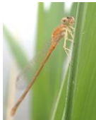
アジアイ トトンボ